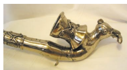
Art ivoirien en métal

Vous sentez-vous séduit ? Voulez-vous dénicher la perle rare ? Faire de bonnes affaires ? Êtes-vous prêt à foncer sans tar-