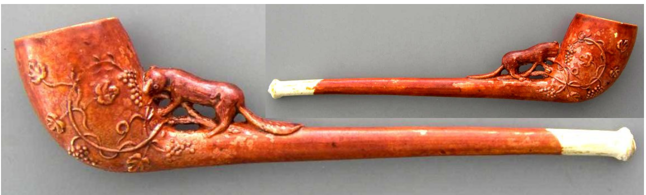
« Le Renard aux raisins » pipe néogène fantaisie en terre blanche glacée n° 167 du catalogue. Collections Amsterdam Pipe Museum.