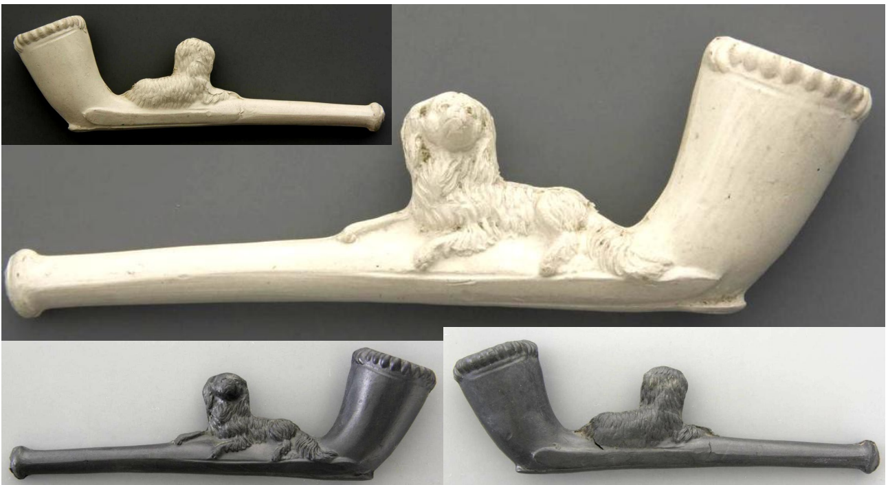
« Chien » fume-cigare fantaisies en terre blanche et terre noire n° 133 du catalogue. Collections Amsterdam Pipe Museum.