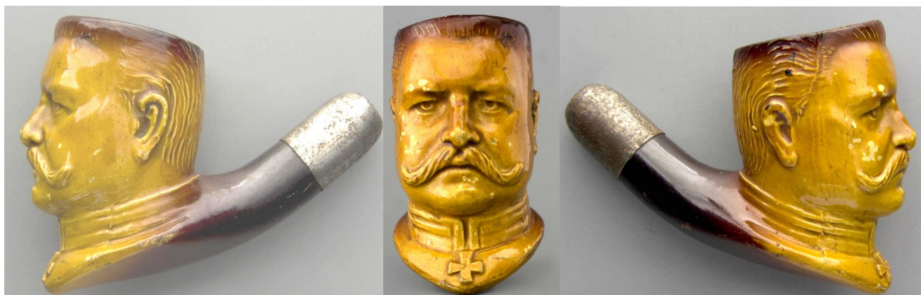
« Maréchal von Hindenburg » tête de pipe en terre blanche glacée, virole métallique. Collections Amsterdam Pipe Museum.