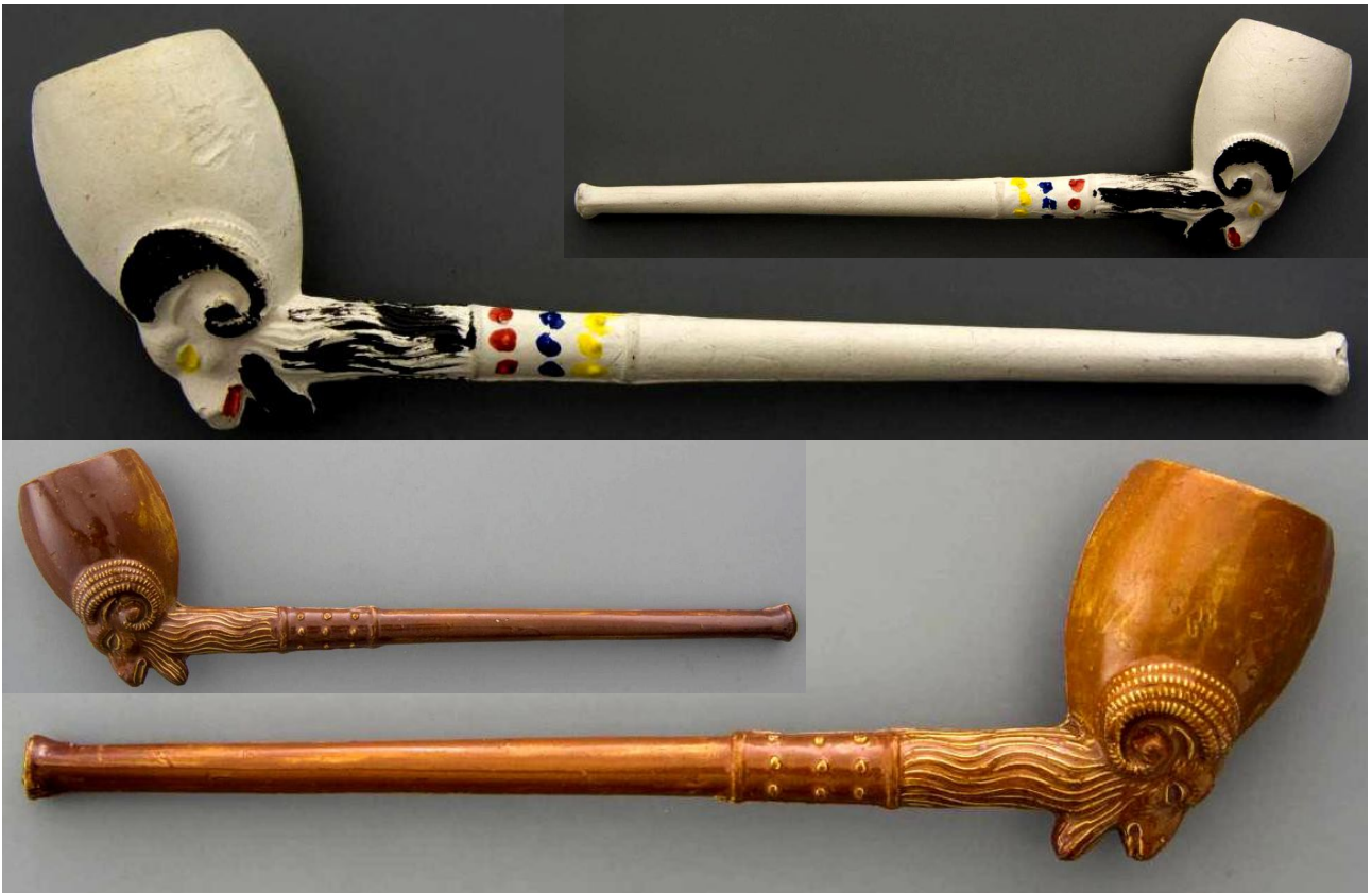
« Bouc » pipes néogènes fantaisies en terre blanche grossièrement émaillée et en terre blanche glacée n° 102 du catalogue. Collections Amsterdam Pipe Museum.