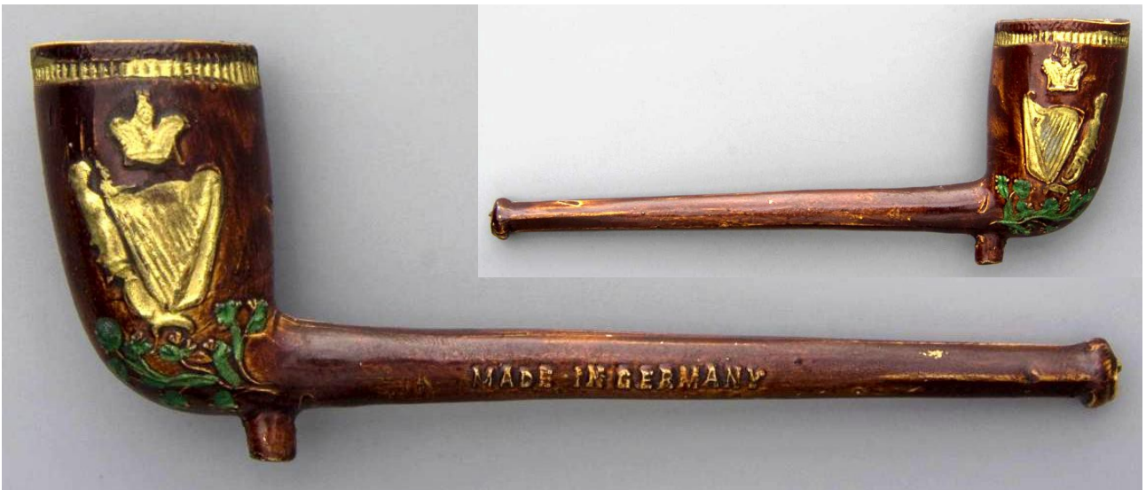
« Irlande » pipe néogène en terre blanche glacée et émaillage vert sur les feuillages et rehauts dorés sur les lyres irlandaises qui décorent les côtés du fourneau, marquée en relief « MADE IN GERMANY » n° 148 du catalogue. Collections Amsterdam Pipe Museum.