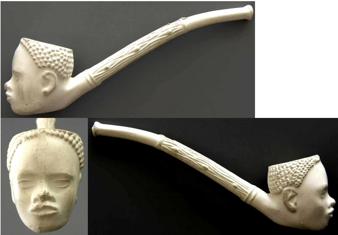
« L'Africain » tête de pipe fantaisie courbe en terre blanche n° 4 du catalogue. Collections Amsterdam Pipe Museum.