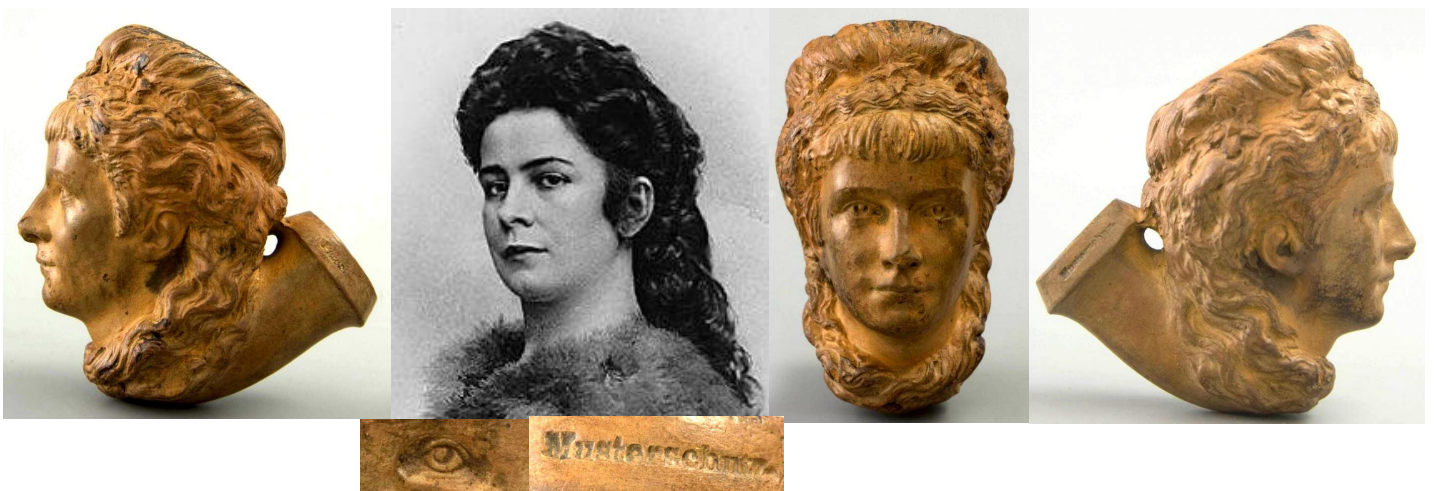
« Elisabeth d'Autriche » tête de pipe en terre ocre, marquée en creux sur le col de la douille « MUNSTERSCHUTZ » et un « œil » en poinçon. Collections Amsterdam Pipe Museum.

Mariée dès l'âge de 16 ans à l'empereur François-Joseph Ier, le 24 avril 1854, elle refuse régulièrement de se plier aux usages de la monarchie, ce qui provoque un conflit durable avec sa belle-mère, l'archiduchesse Sophie de Bavière. Ne pouvant s'adapter à la vie de la cour de Vienne, Elisabeth passe une grande partie de son existence à voyager. Elle perd deux enfants de son vivant, ainsi que des membres de sa famille, parfois de façon tragique. Elle est en partie à l'origine du compromis austro-hongrois de 1867. Son assassinat, en 1898, fait manchette en Europe, car elle jouit d'une bonne réputation sur le continent à cause de sa beauté et des tragédies qui ont marqué sa vie.