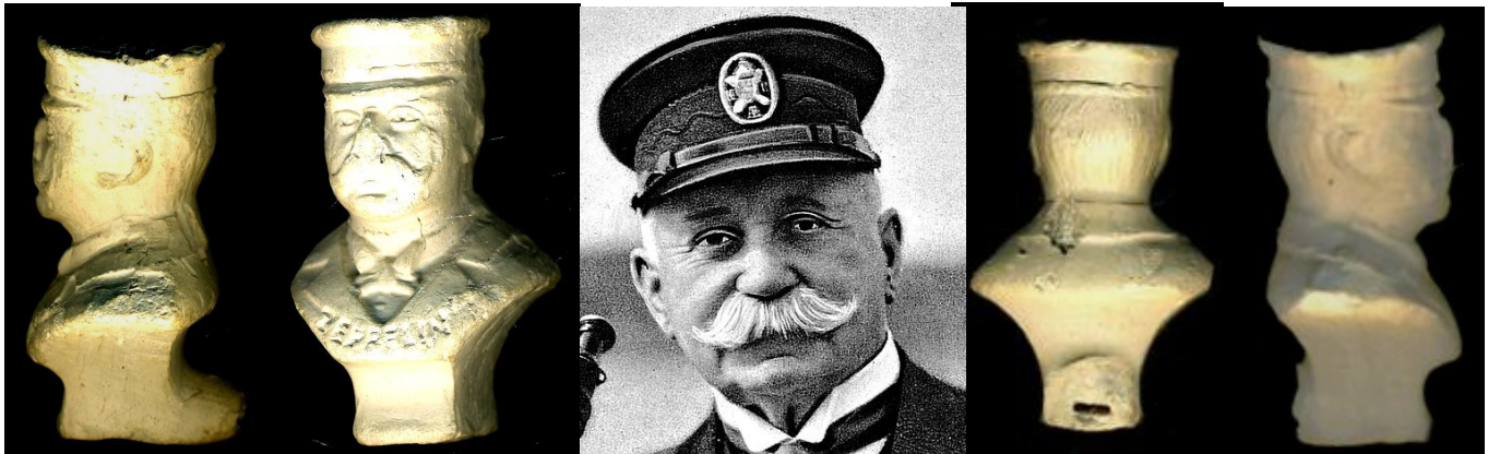
« von Zeppelin » petit sifflet en terre blanche. Collection privée.

Le comte Ferdinand Adolf August Heinrich von Zeppelin , né le 8 juillet 1838 à Constance ( Grand-duché de Bade ) et mort le 8 mars 1917, est un militaire et ingénieur allemand . Il a été le fondateur des sociétés Zeppelin ( Luftschiffbau Zeppelin et Zeppelin-Staaken ) et l'inventeur des aéronefs ( ballons dirigeables ) portant son nom.