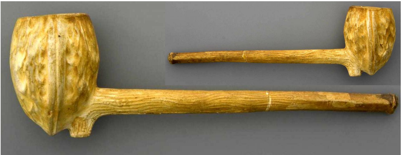
« Noix » pipe néogène fantaisie en terre blanche glacée n° 152 du catalogue. Collections Amsterdam Pipe Museum.