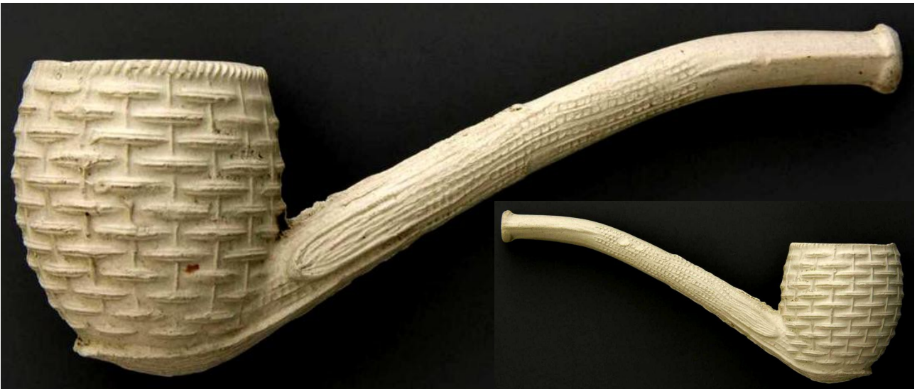
« Panier » pipe néogène courbe en terre blanche n° 77 du catalogue. Collections Amsterdam Pipe Museum.