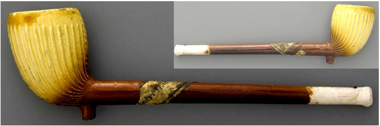
« Côtes » pipe néogène en terre blanche glacée deux tons portant sur le tuyau une étiquette « Pipe ambre Paris » n° 149 du catalogue. Collections Amsterdam Pipe Museum.