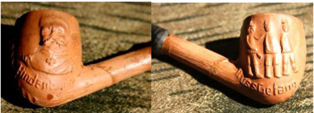
« Maréchal von Hindenburg » tête de pipe néogène fantaisie en terre rouge, en relief d'un côté du fourneau le buste du maréchal et sous celui-ci en relief « HINDENBURG » de l'autre côté, 3 personnages en relief avec l'inscription « RUSSGEFANG » sous ceux-ci. Documentation privée.