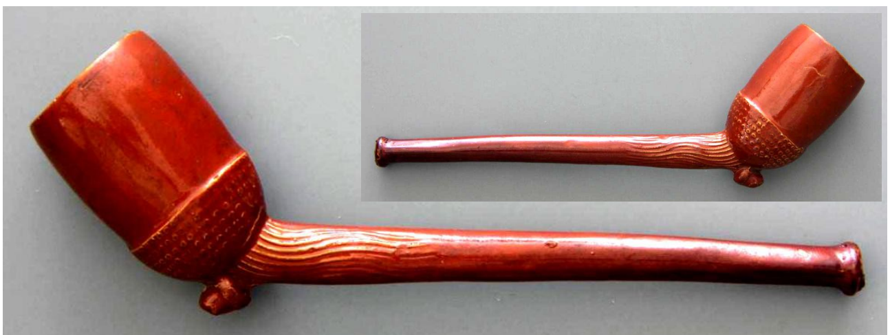
« Gland » pipe néogène fantaisie en terre blanche glacée n° 44 du catalogue. Collections Amsterdam Pipe Museum.