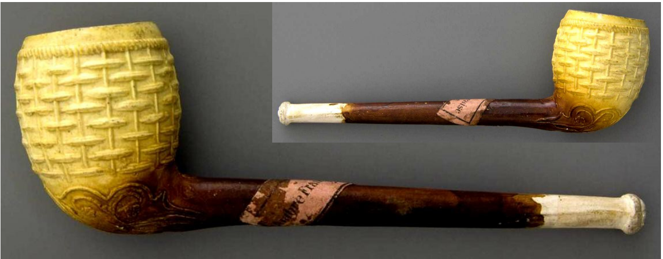
« Panier » pipe néogène en terre blanche glacée deux tons portant sur le tuyau une étiquette « Ambre française Paris » n° 76 du catalogue. Collections Amsterdam pipe Museum.