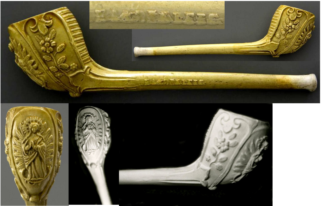
« Kevelaer » pipes néogènes souvenir de pèlerinage en terre blanche glacée (Collections Amsterdam Pipe Museum) et en terre blanche (collection privée) n° 145 du catalogue, toutes deux marquées en relief sur un côté du tuyau « KEVELAER ».