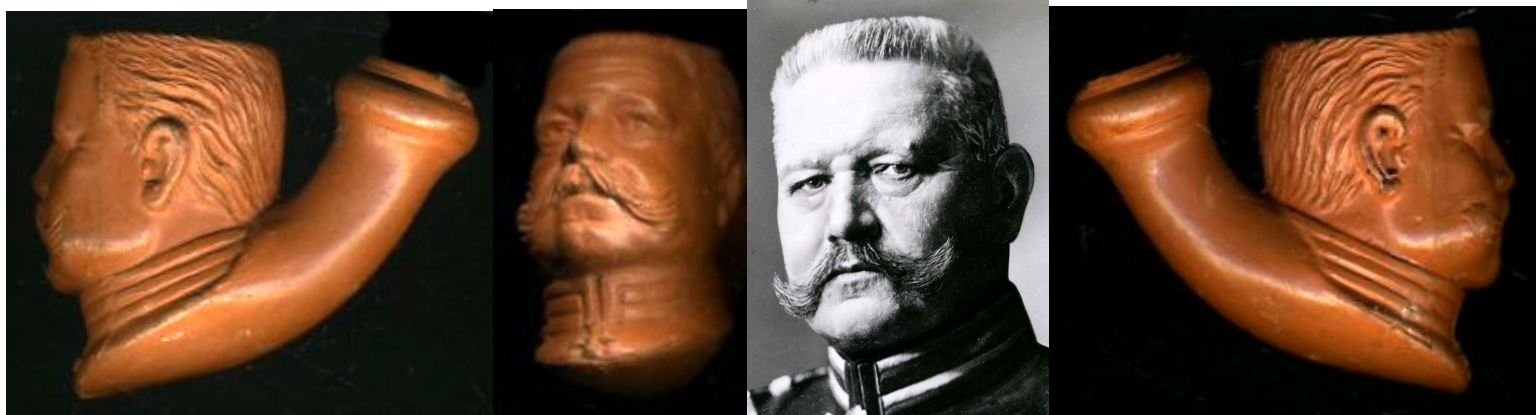
« Maréchal von Hindenburg » tête de pipe en terre rouge. Collection privée.

Auréolé de son prestige militaire que la défaite de l'Empire allemand n'a pas affecté, le maréchal von Hindenburg est élu président du Reich à l'issue du scrutin présidentiel d'avril 1925 ; il succède au social-démocrate Friedrich Ebert, décédé dans l'exercice de ses fonctions. Aisément réélu pour un second septennat, le président Hindenburg n'empêche cependant pas l'ascension politique d'Adolf Hitler, qu'il nomme chancelier du Reich. Après sa mort en 1934, Hitler supprime la fonction de président du Reich et s'octroie tous les pouvoirs.