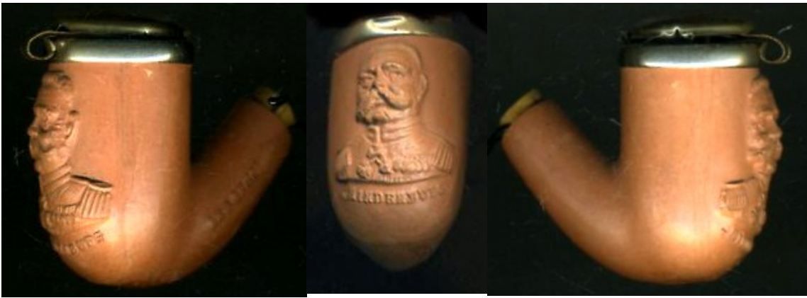
« Maréchal von Hindenburg » tête de pipe néogène en terre rouge avec couvercle argenté, buste du maréchal en relief à l'avant du fourneau et marquée en relief sous celui-ci « HINDENBURG » et sur un côté de la douille « GES GESCH ». Collection privée.