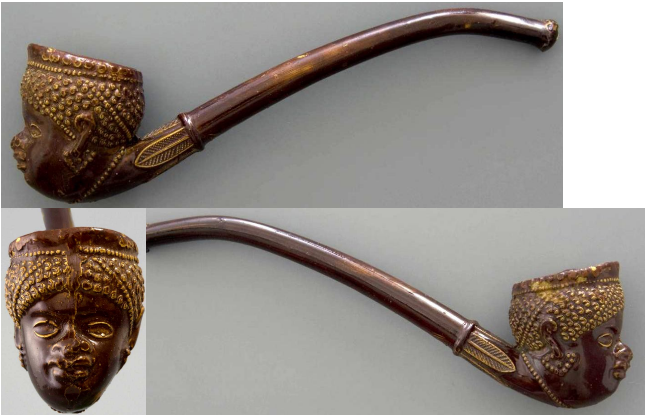
« L'Africaine » tête de pipe fantaisie courbe en terre noire avec rehauts dorés n° 2 du catalogue. Collections Amsterdam Pipe Museum.