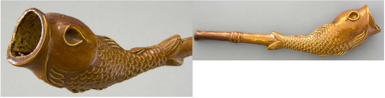
« Poisson » fume-cigare en terre blanche glacée n° 61 du catalogue. Collections Amsterdam Pipe Museum.