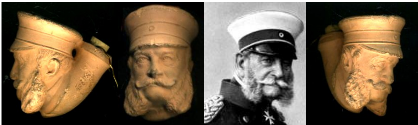
« Kaiser Guillaume Ier » tête de pipe en terre ocre sans marque. Collection privée.

Guillaume Frédéric Louis de Hohenzollern , né le 22 mars 1797 à Berlin et mort le 9 mars 1888 dans la même ville, est le septième roi de Prusse de 1861 à 1888, et le premier empereur allemand de 1871 à 1888 sous le nom de Guillaume Ier