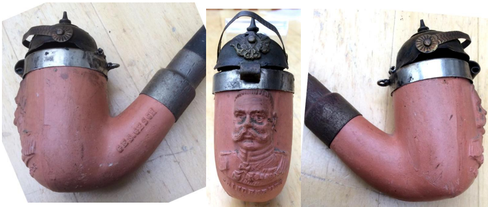
« Maréchal von Hindenburg » tête de pipe néogène en terre rouge avec couvercle en forme de casque à pointe, buste du maréchal en relief à l'avant du fourneau et marquée en relief sous celui-ci « HINDENBURG » et sur un côté de la douille « GES GESCH ». Documentation privée.