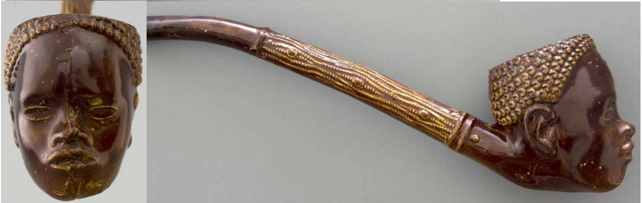
« L'Africain » tête de pipe fantaisie courbe en terre noire avec rehauts dorés n° 4 du catalogue. Collections Amsterdam Pipe Museum.