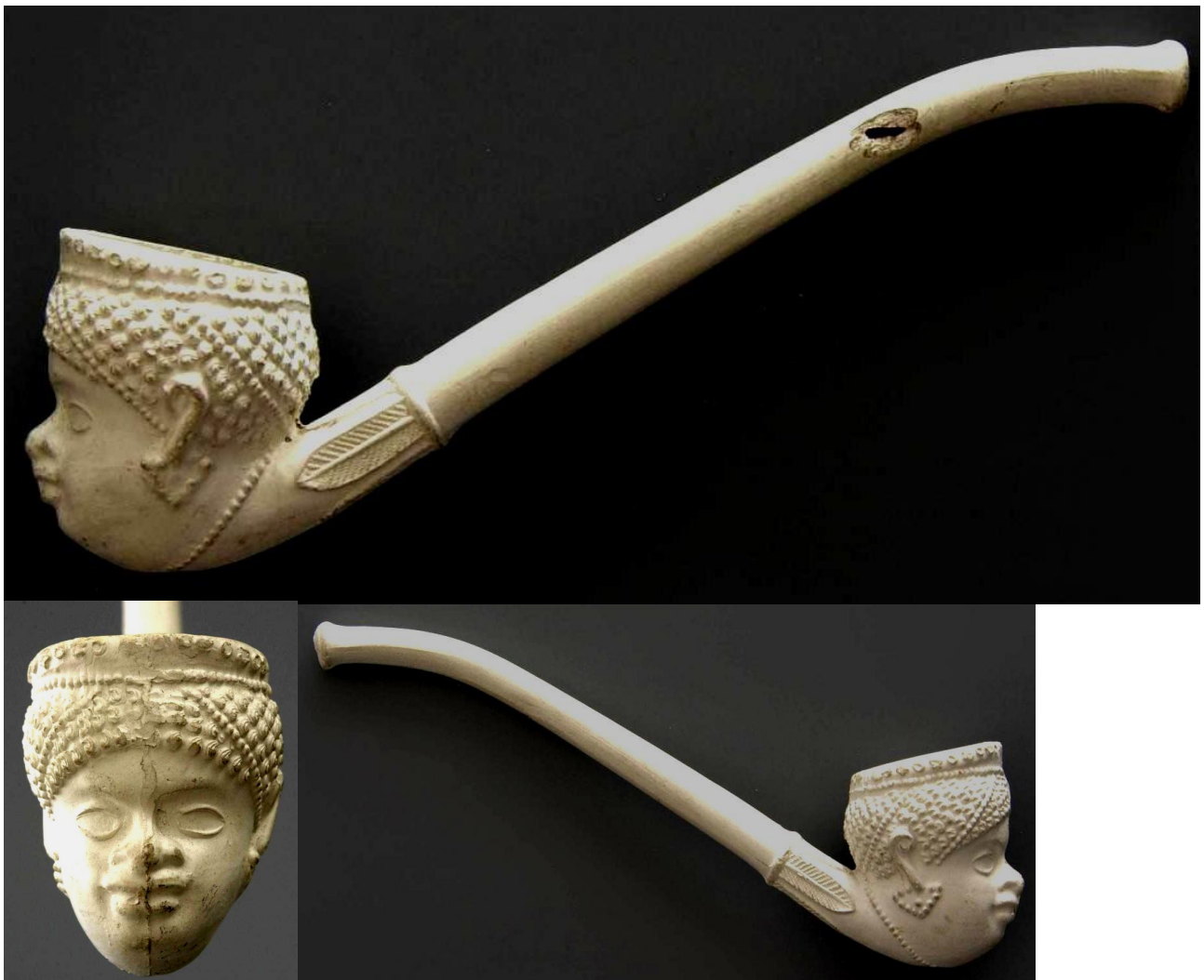
« L'Africaine » tête de pipe fantaisie courbe en terre blanche n° 2 du catalogue. Collections Amsterdam Pipe Museum.