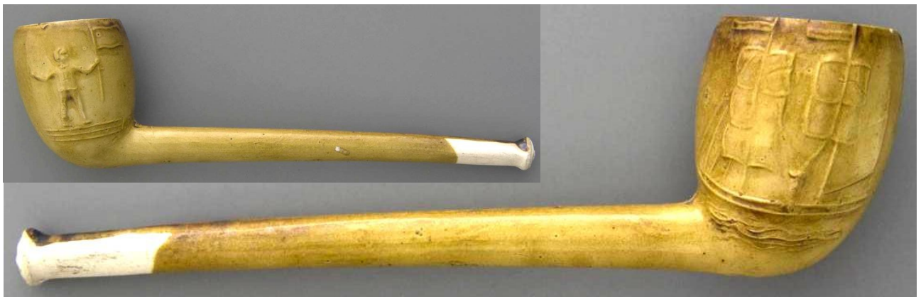
« Voilier et matelot » pipe néogène en terre blanche glacée et au fourneau décoré d'un côté d'un voilier et de l'autre d'un personnage agitant un drapeau n° 25 du catalogue.