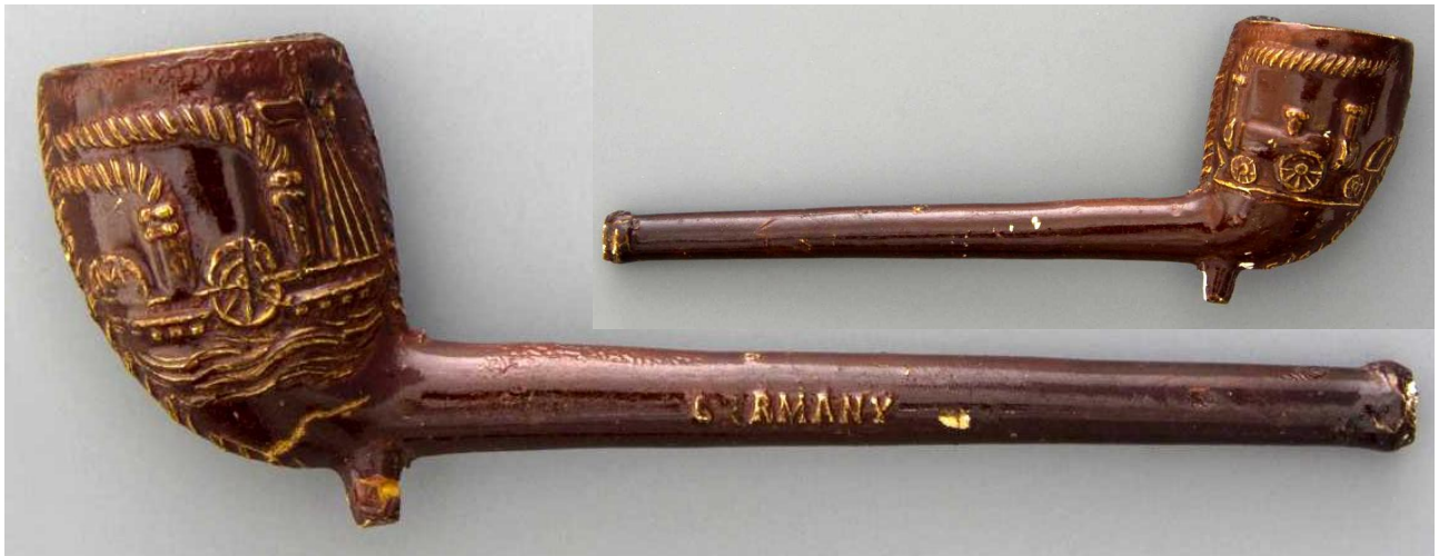
« Bateau et train à vapeur » pipe néogène en terre blanche glacée et au fourneau décoré d'un côté d'un bateau à vapeur et de l'autre d'un train à vapeur, tuyau marqué d'un côté « GERMANY » n° 23 du catalogue. Collections Amsterdam Pipe Museum.