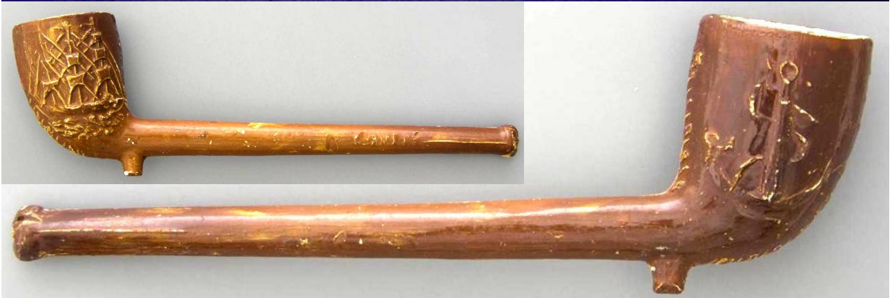
« Marine » pipes néogènes en terre blanche glaçage clair et émaillée et glaçage foncé décorées sur le fourneau d'un côté d'un voilier et de l'autre d'une ancre, d'un côté du tuyau en relief « GERMANY » n° 151 du catalogue. Collections Amsterdam Pipe Museum.