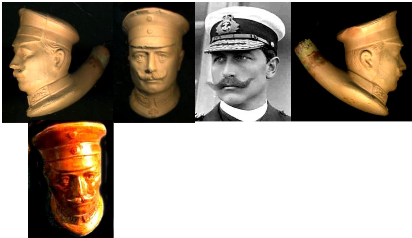
« Kaiser Guillaume II » tête de pipe en terre ocre (collection privée) et en terre blanche glacée (documentation privée) sans marque.

Ses prénoms ont été donnés en hommage à son grand-oncle Frédéric-Guillaume IV, régnant lors de sa naissance, et à ses grands-parents.