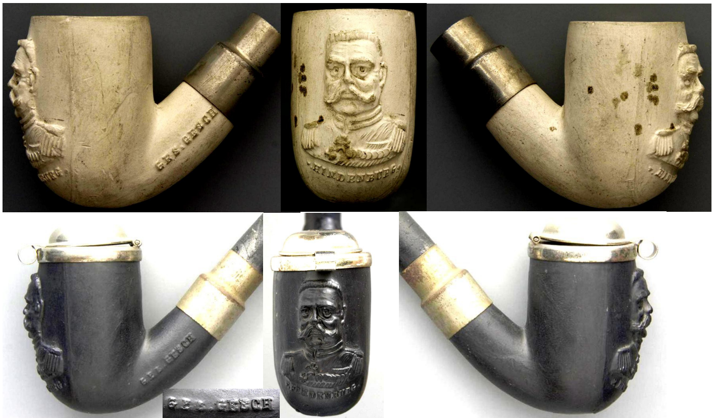
« Maréchal von Hindenburg » têtes de pipe néogènes en terre blanche sans couvercle et en terre noire avec couvercle, grosses viroles métalliques, buste du maréchal en relief à l'avant du fourneau et marquée en relief sous celui-ci « HINDENBURG », et sur un côté de la douille « GES GESCH » Collections Amsterdam Pipe Museum.