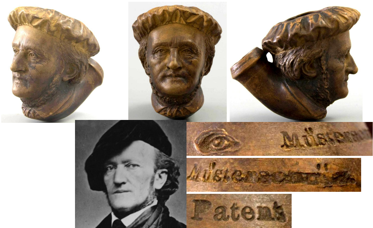
« Richard Wagner » tête de pipe en terre foncée, marquée en creux sur le col de la douille « PATENT » « MUSTERSCHUTZ » un « œil » poinçonné. Collection Amsterdam Pipe Museum.

Élisabeth Amélie Eugénie de Wittelsbach , duchesse en Bavière puis, par son mariage, impératrice d'Autriche et reine de Hongrie, de Bohême et de Lombardie-Vénétie , est née le 24 décembre 1837 à Munich , dans le royaume de Bavière , et morte assassinée le 10 septembre 1898 à Genève .