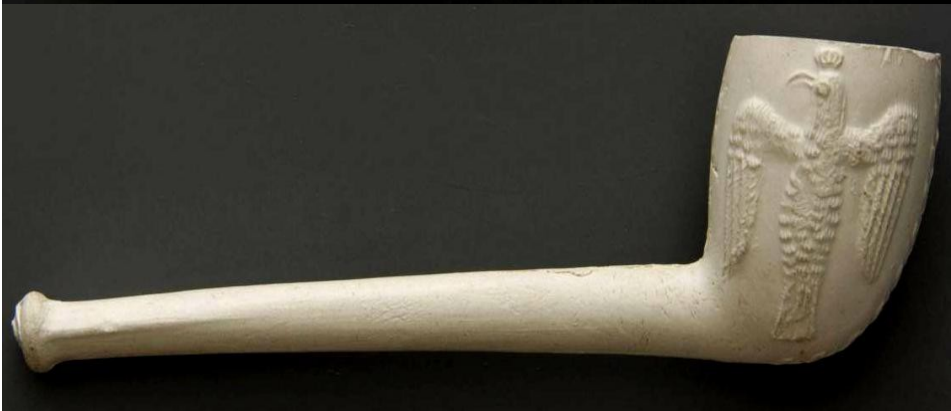
« Aigle » pipe néogène en terre blanche décorée d'un aigle sur les 2 faces du fourneau. Collections Amsterdam Pipe Museum.