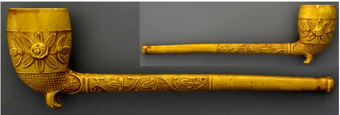
« Marguerite » pipe néogène en terre blanche glacée, décor fleuri, n° 165 du catalogue. Collections Amsterdam Pipe Museum.