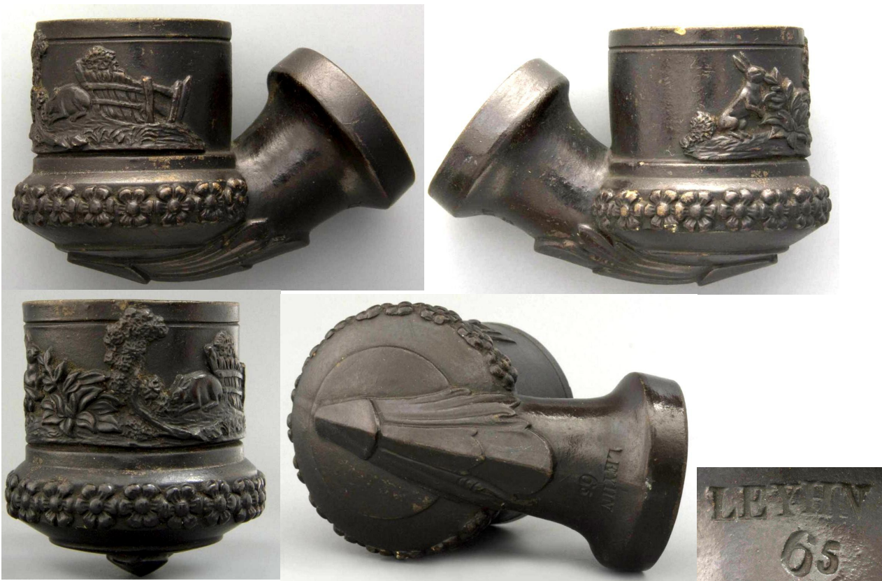
« Faune » grosse tête de pipe néogène à décor forestier en terre blanche colorée en brun rehaussé de doré, n° 65. Collections Amsterdam Pipe Museum.