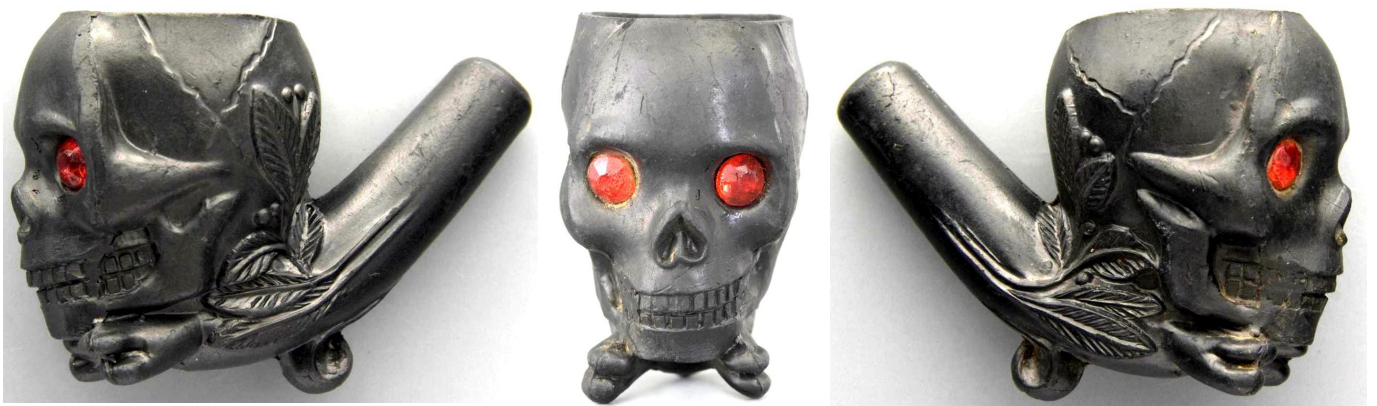
« Tête de mort » tête de pipe en terre noire, yeux en verre. Collections Amsterdam Pipe Museum.. Auraient été, paraît-il, particulièrement appréciée des « Hussards de la Mort » unité d'élite prussienne.