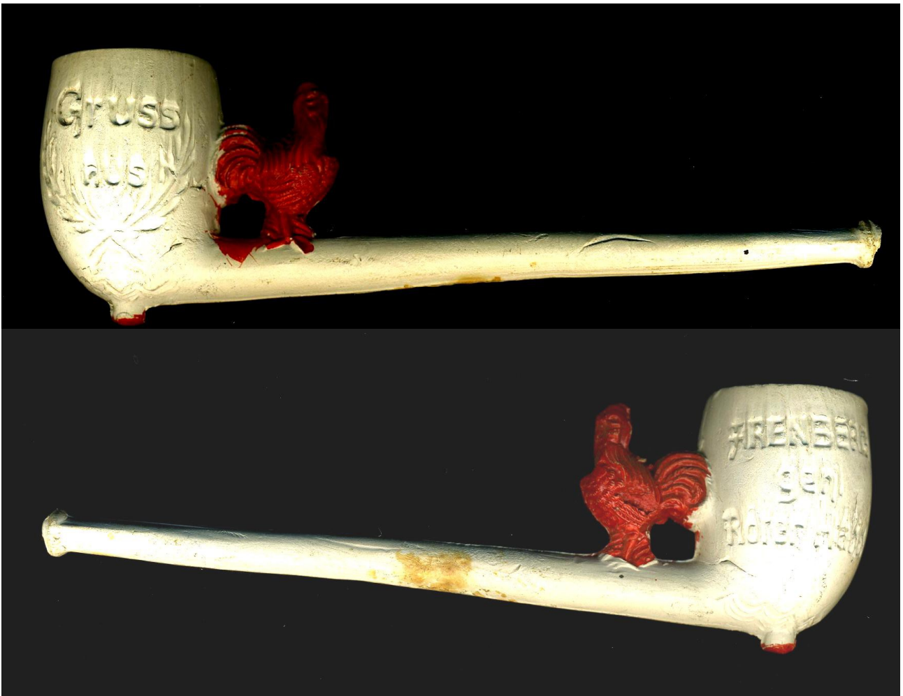
« Arenberg » pipe néogène fantaisie en terre blanche émaillée, n° 207 ; marquée d'un côté du fourneau « GRUSS AUS » et de l'autre côté « ARENBERG DER ROTE HAM ». Collection privée.