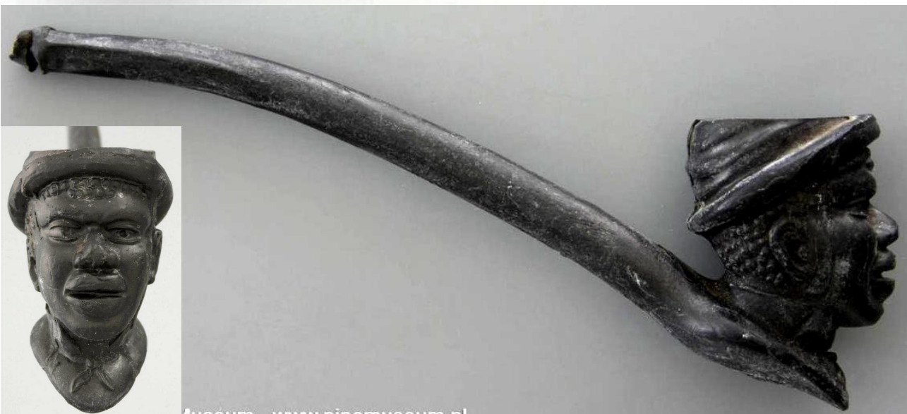
« L'Africain » tête de pipe fantaisie courbe en terre noire, n° 27 marquée sur le tuyau « J.S.M ». Collections Amsterdam Pipe Museum.