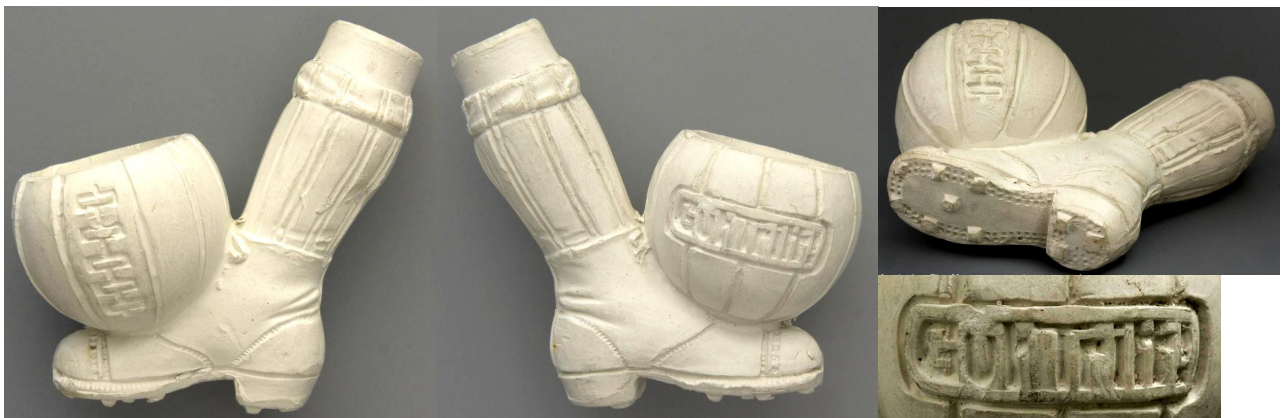
« Football » tête de pipe fantaisie en terre blanche, le ballon porte en creux « GUT-TRIT ». Collections Amsterdam Pipe Museum.