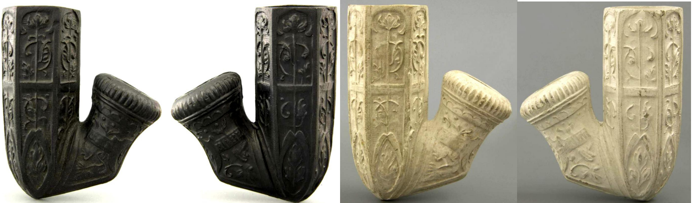
« Café viennois » têtes de pipe en terre noire et terre blanche à fourneau hexagonal. Collections Amsterdam Pipe Museum.