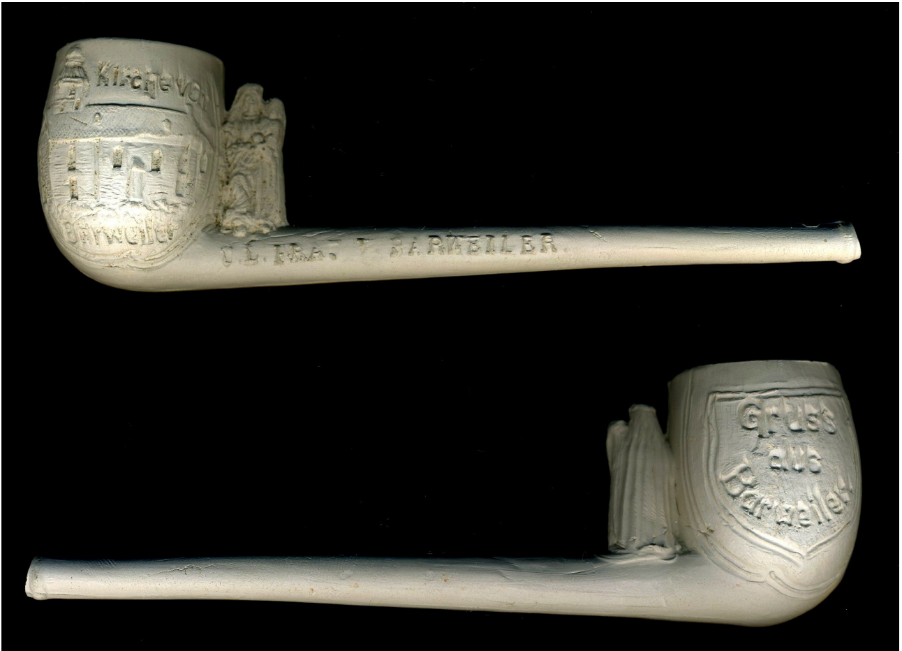
« Barweiller » pipe néogène souvenir de pèlerinage marquée d'un côté du tuyau « KIRCH BARWEILLER », sur un côté du fourneau « O.L.VROUW BARWEILLER » et de l'autre côté « GRUSS AUS BARWEILLER ». Collection privée.