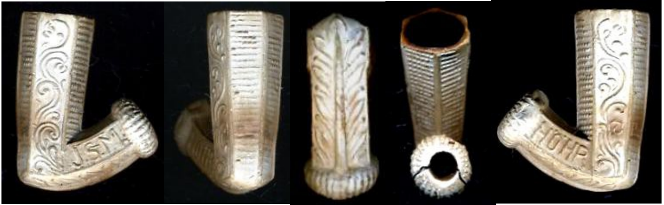
« Café viennois » tête de pipe en terre blanche légèrement culottée à fourneau hexagonal, sur 1 côté de la douille « J.S.M. » et sur l'autre côté « HÖHR ». Collection privée.