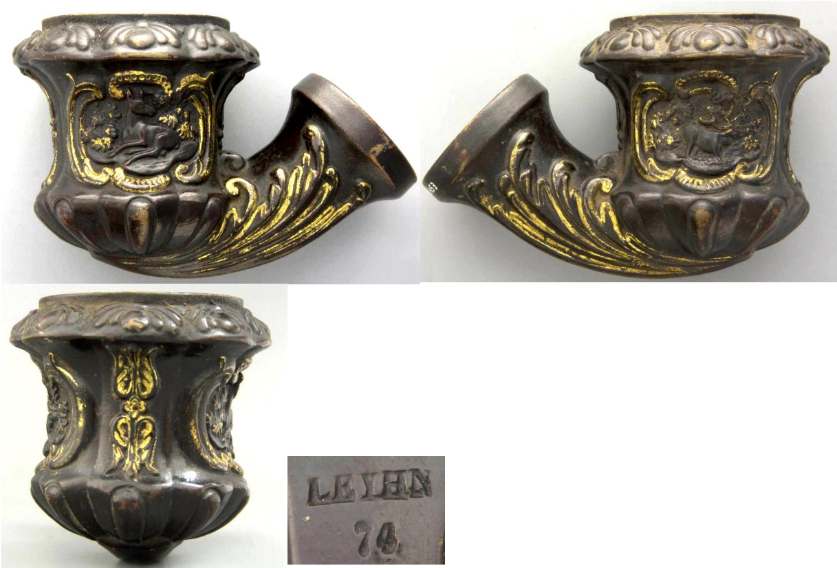
«Gibier » grosse tête de pipe néogène à décor forestier en terre blanche colorée en brun rehaussé de doré, n° 74. Collections Amsterdam Pipe Museum.