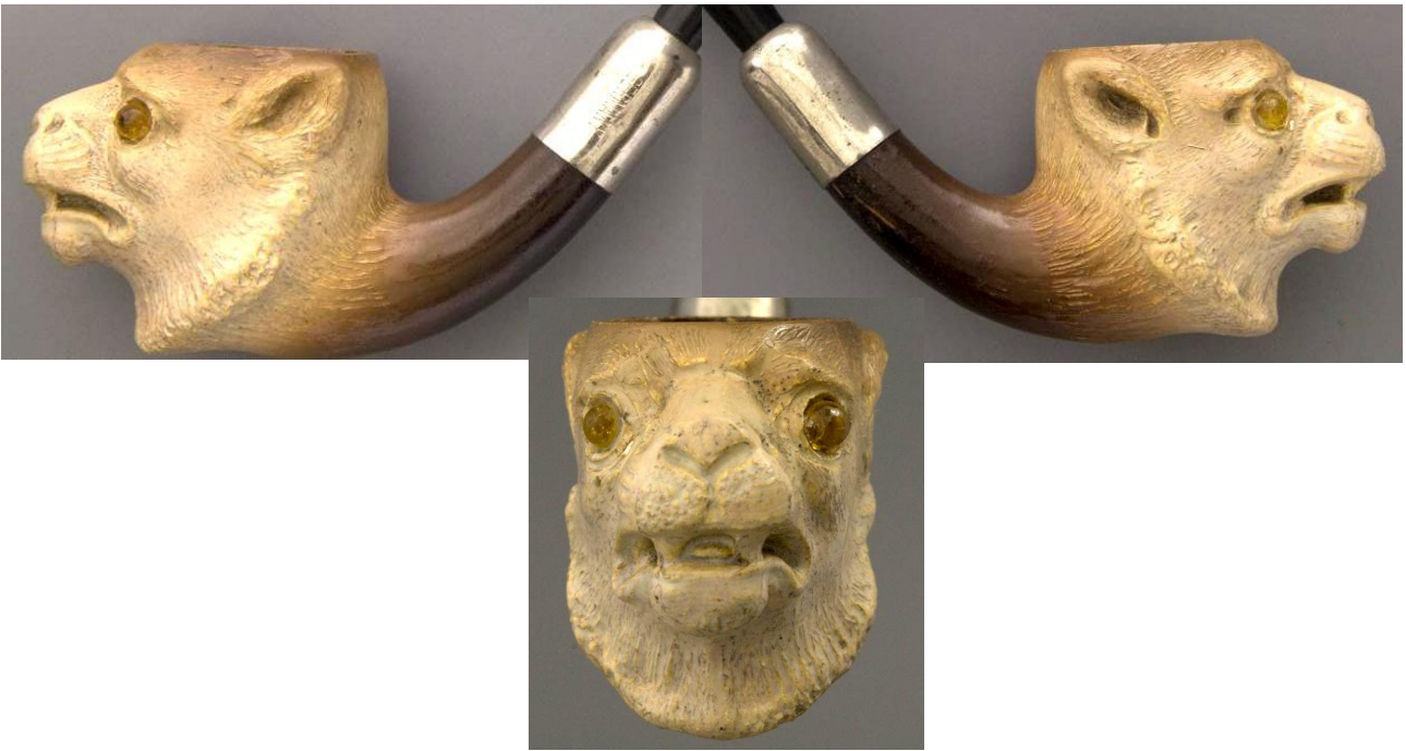
« Le Lion » tête de pipe zoomorphe en terre blanche glacée. Collections Amsterdam Pipe Museum.