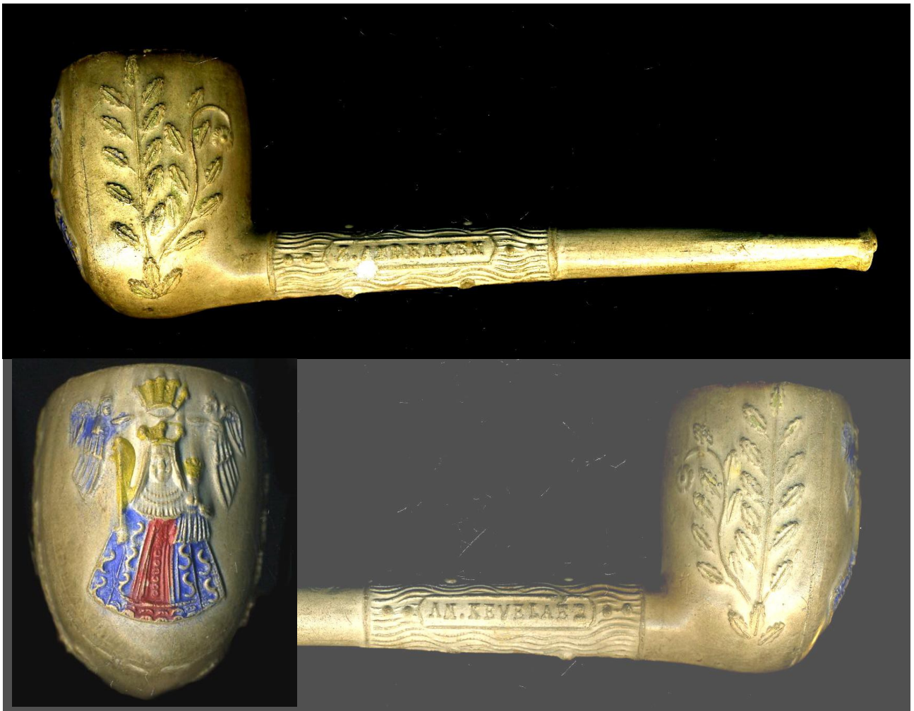
« Pèlerinage à Kevelaer » pipe néogène fantaisie droite en terre blanche émaillée et culottée, n° 39 marquée d'un côté du tuyau « Z.ANDENKEN » et de l'autre côté « AM KEVELAER » sur le devant du fourneau, sous la Vierge « KEVELAER ». Collection privée.