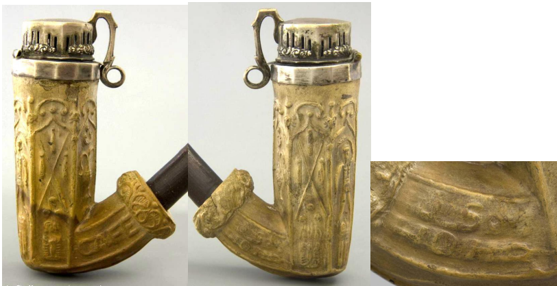
« Café viennois » tête de pipe en terre blanche culottée au fourneau hexagonal avec son couvercle en métal argenté n° 125 marquée sur un côté de la douille « J.S M HÖHR ».. Collections Amsterdam Pipe Museum.