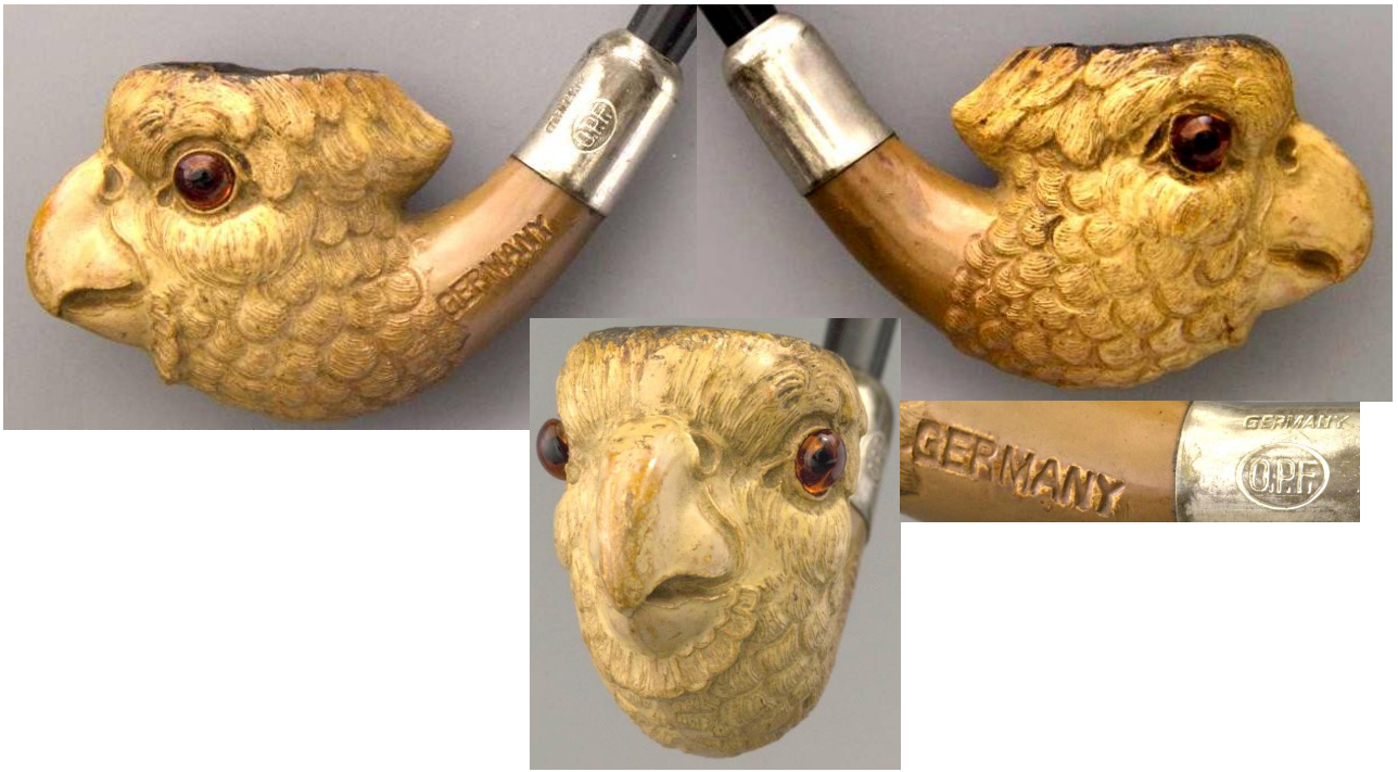
« Le Perroquet » tête de pipe zoomorphe en terre blanche glacée, yeux en verre rouge, marquée d'un côté de la douille « GERMANY », virole marquée « GERMANY O.P.F. ». Collections Amsterdam Pipe Museum.