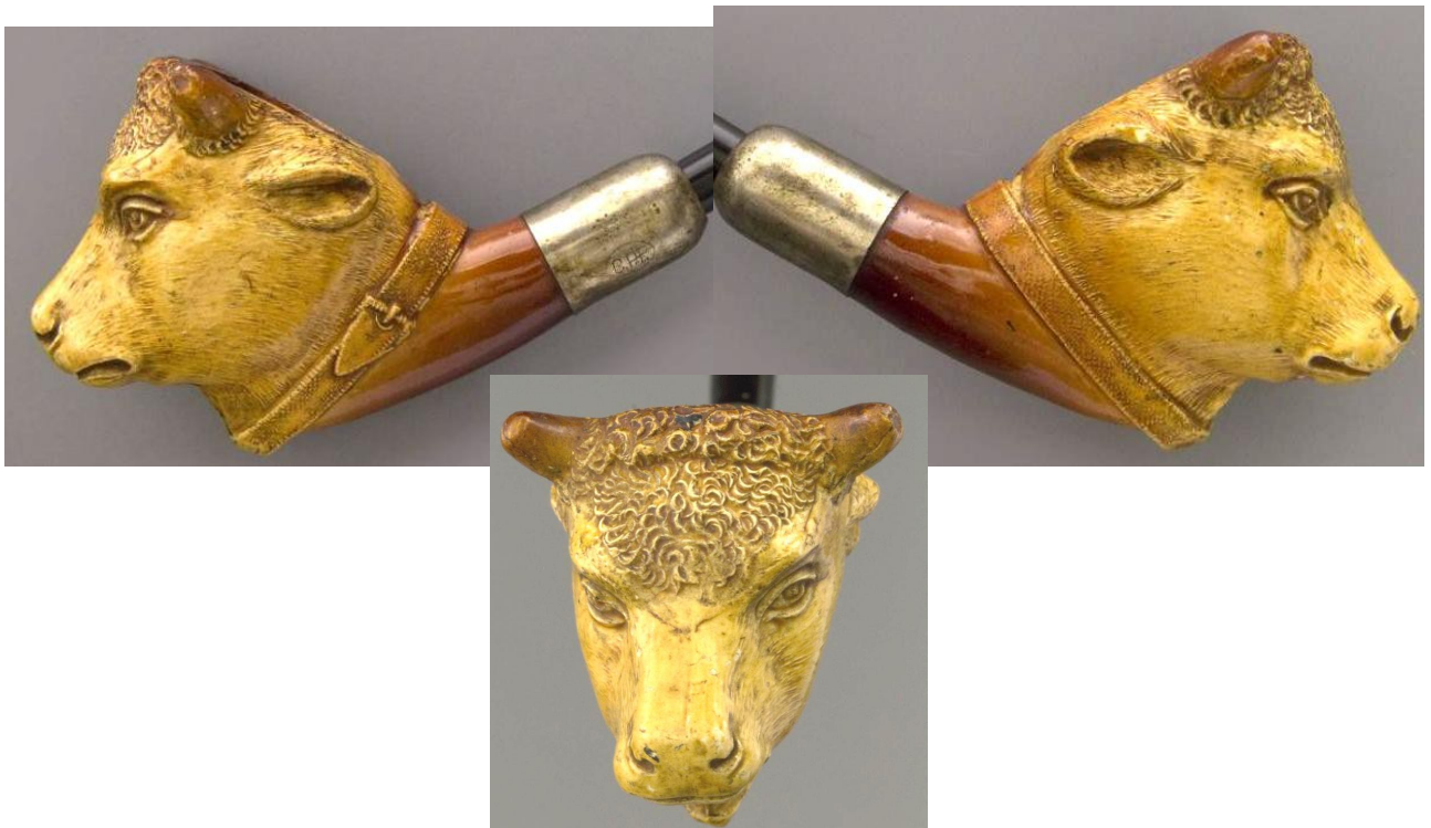
« Le Bœuf » tête de pipe zoomorphe en terre blanche glacée. Collections Amsterdam Pipe Museum.