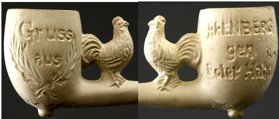
Même modèle en terre blanche. Collections Amsterdam Pipe Museum.