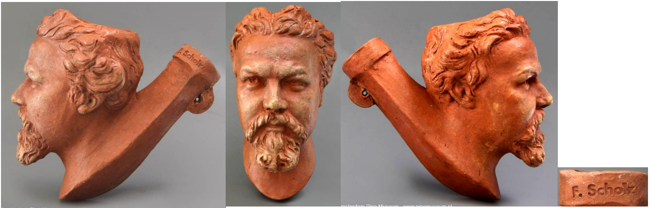
« Homme » tête de pipe en terre rouge marquée « F.SCHOLZ » sur la douille. Collections Amsterdam Pipe Museum.