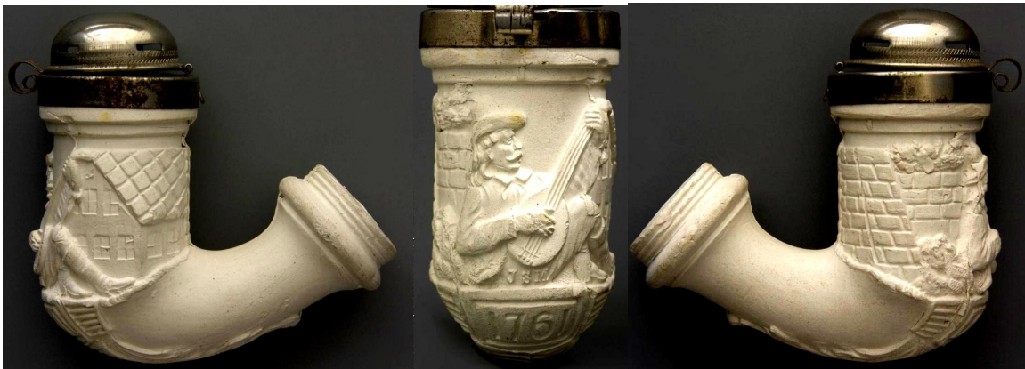
« Le Troubadour » grosse tête de pipe néogène avec couvercle en métal argenté et décorée d'une scène romantique. Collections Amsterdam Pipe Museum.