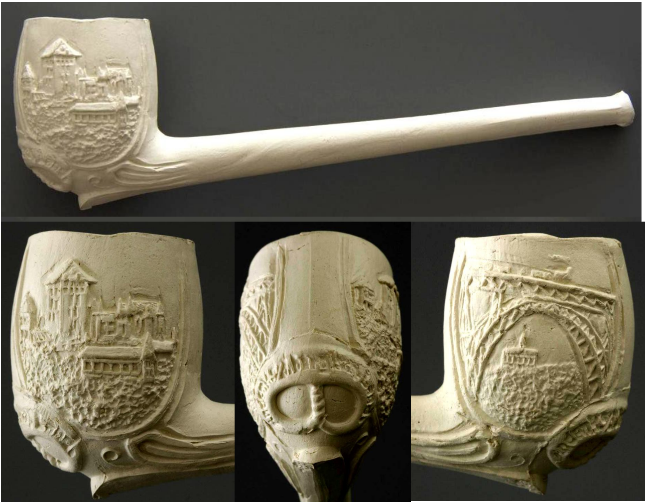
« Paysages » pipe néogène droite en terre blanche délicatement décorée. Collections Amsterdam Pipe Museum.