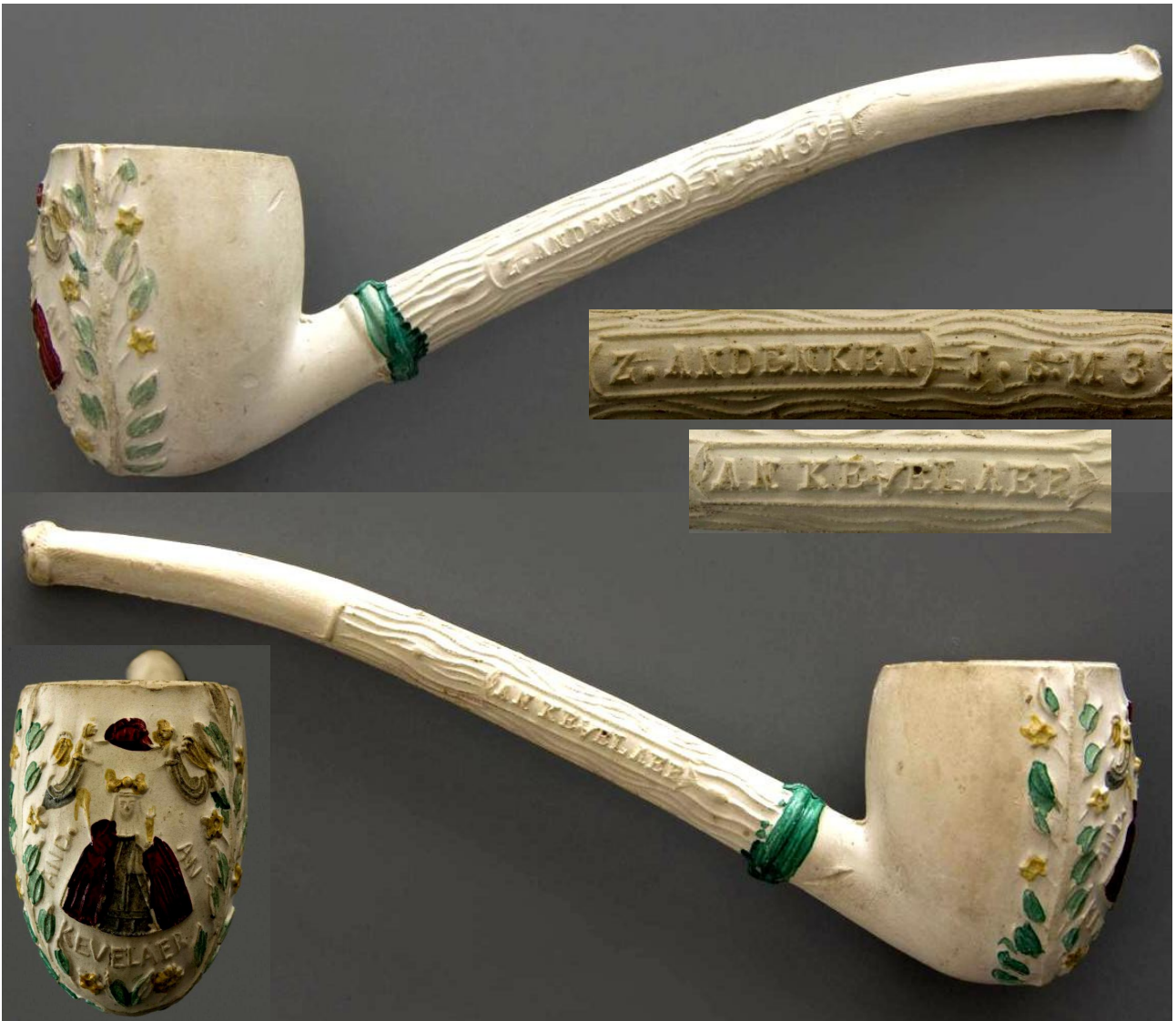
« Pèlerinage à Kevelaer » pipe néogène fantaisie courbe en terre blanche émaillée, n° 39 marquée d'un côté du tuyau « Z.ANDENKEN » et de l'autre côté « AM KEVELAER » sur le devant du fourneau, sous la Vierge « KEVELAER ». Collections Amsterdam Pipe Museum.