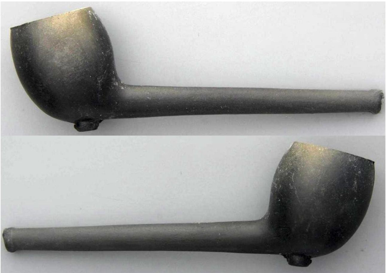
« Le Gland » pipe néogène droite en terre noire. Collections Amsterdam Pipe Museum.